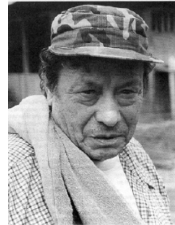
Manuel Marulanda "Tirofijo"

(Source : Monde Diplomatique 2001 / HRW rapport 2000)